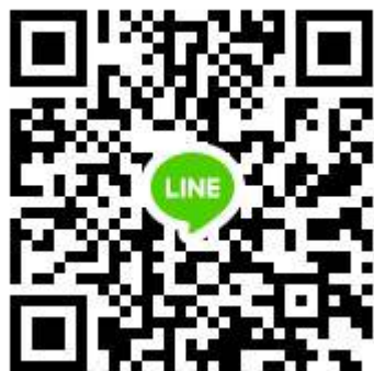
34週年校慶趣味競賽群組